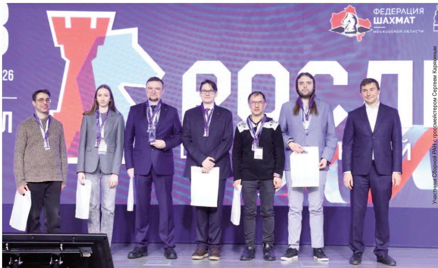
Участники Сборной РАН с гроссмейстером Сергеем Карякиным